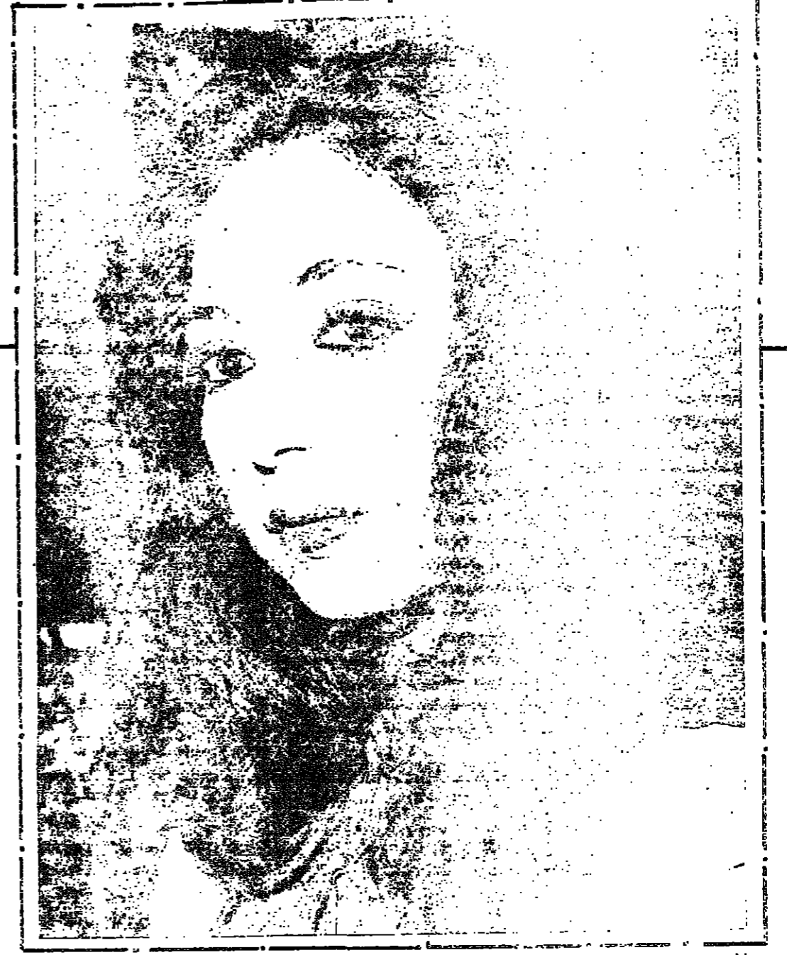
غيت غربية في إحدى حفلاتها

في الواقع ان الدول العربية كلها لم تصل حتى الآن الى المستوى الكسافي لطبيب الفنان لانفسه لا يوجد وغيتي لا عند المسؤولين ولا عند غيرهم .. من هنا اصيب الفنان بهذا الشعور .. لكن اعود لاقول .. اسي اعتقد ان الوقت الذي نعيشه اليوم افضل من الوقت الذي مر على غيتنا من الفنانين .. ● ما هو رأيك بالفن الخليجي وخاصة انك غيت اغاني خليجية؟ - الفن الخليجي جيد .. واعتز بالفنسة محربية واخرى عربية .. ولها عاطفة خاصة في قلبي .. وانتم ايضا .. الاولى هي « يا زين .. يا زين » والثانية اسمها « مني » وهي تتكلم عن الامم .. ● لو فرض عليك تغيير لوتك .. فهل ترضين ؟ - طبعا اقبل لو صار لي اغني ياياتي .. وغيت كثيرا .. نعم اغني ياياتي لا شيء .. يحضني انا ايس عندي نحل لون افريقي او الخليجي او العربي بصورة عملة .. ● من خلال الحديث لمست انك ترفضين الزواج لانك دخلت ميدان الفن .. ما نسبة الصحة في هذا الشعور ؟ - انا اتدس الزواج لدرجة كبيرة لان الفتاة عندما تزوج عليها ان تنهم بزوجها وبينها واولادها .. وبيني تفكرها ضمن هذه الدائرة .. علون نظرت الي انا ويحكم علي اجد انه من المستحيل ان اقبض عن بيتي وزوجي شهرين او ثلاثة لانه لا يوجد رجل في الدنيا يقبل ذلك .. وانا كذلك لا يمكن ان اقبل ان اتخل عن زوجي ثلاثة اشهر ولا حتى عشرة ايام .. هذا الذي يعني من التفكير في الزواج الان .. ● اذا حق القلوب .. هل تعتدين ؟ - لان لم يخفق هذا القلب .. هل لك رأي في كلمات الاغنية التي تغنيها .. وهل تخفين عليها تعديلات ؟ ● احيانا اغني عندما تكون هناك كلمات في الاغنية غير موسيقية والمؤلف لم يلفظ بها من ذلك .. مثل الكلام الذي يكون نازلا على الاذن .. عندما اقترح على المؤلف نجد الحل الوسط بالطبع .. عن « البيضة » الكويتية